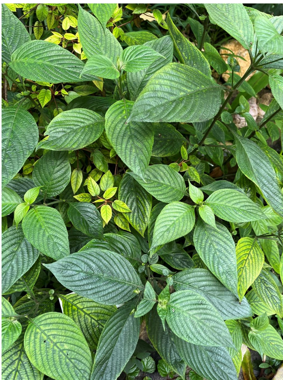
Sortie au jardin botanique de Neuchâtel 17 octobre 2025