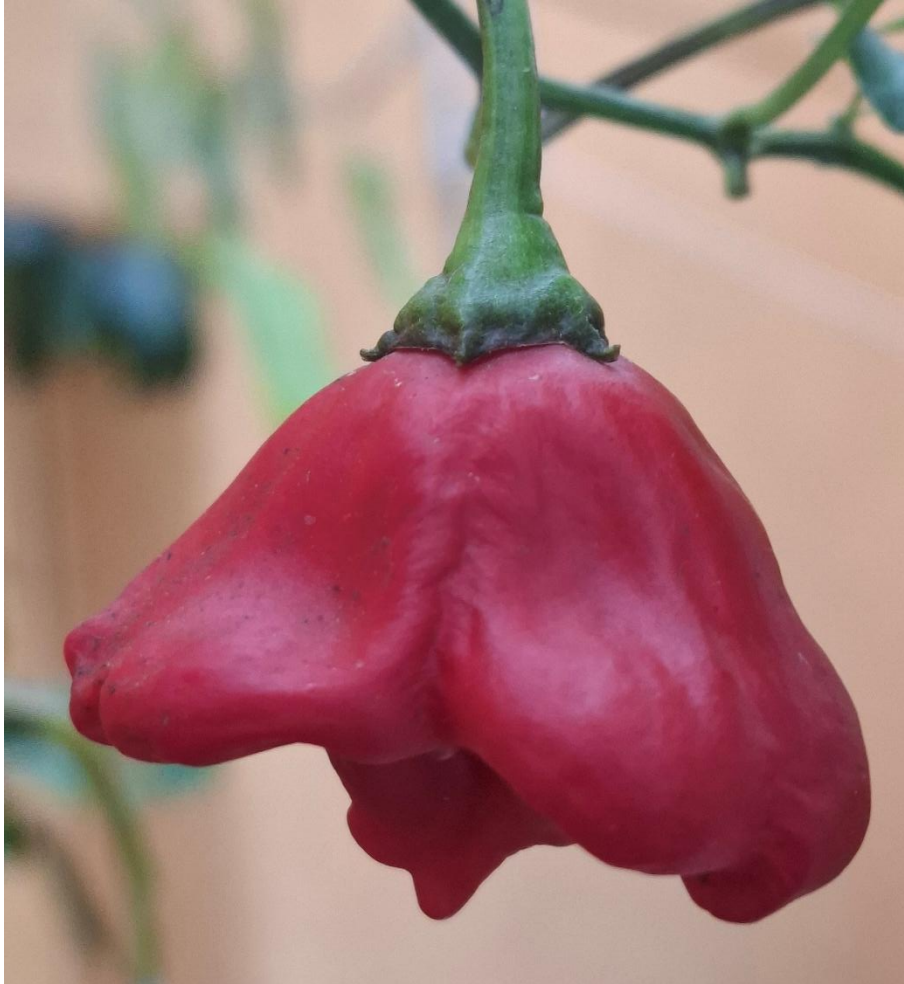
Sortie au jardin botanique de Neuchâtel 17 octobre 2025