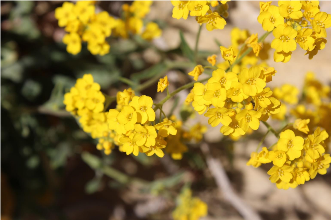
Exposition « Poésie de fleurs » Le Déclic automne 2023