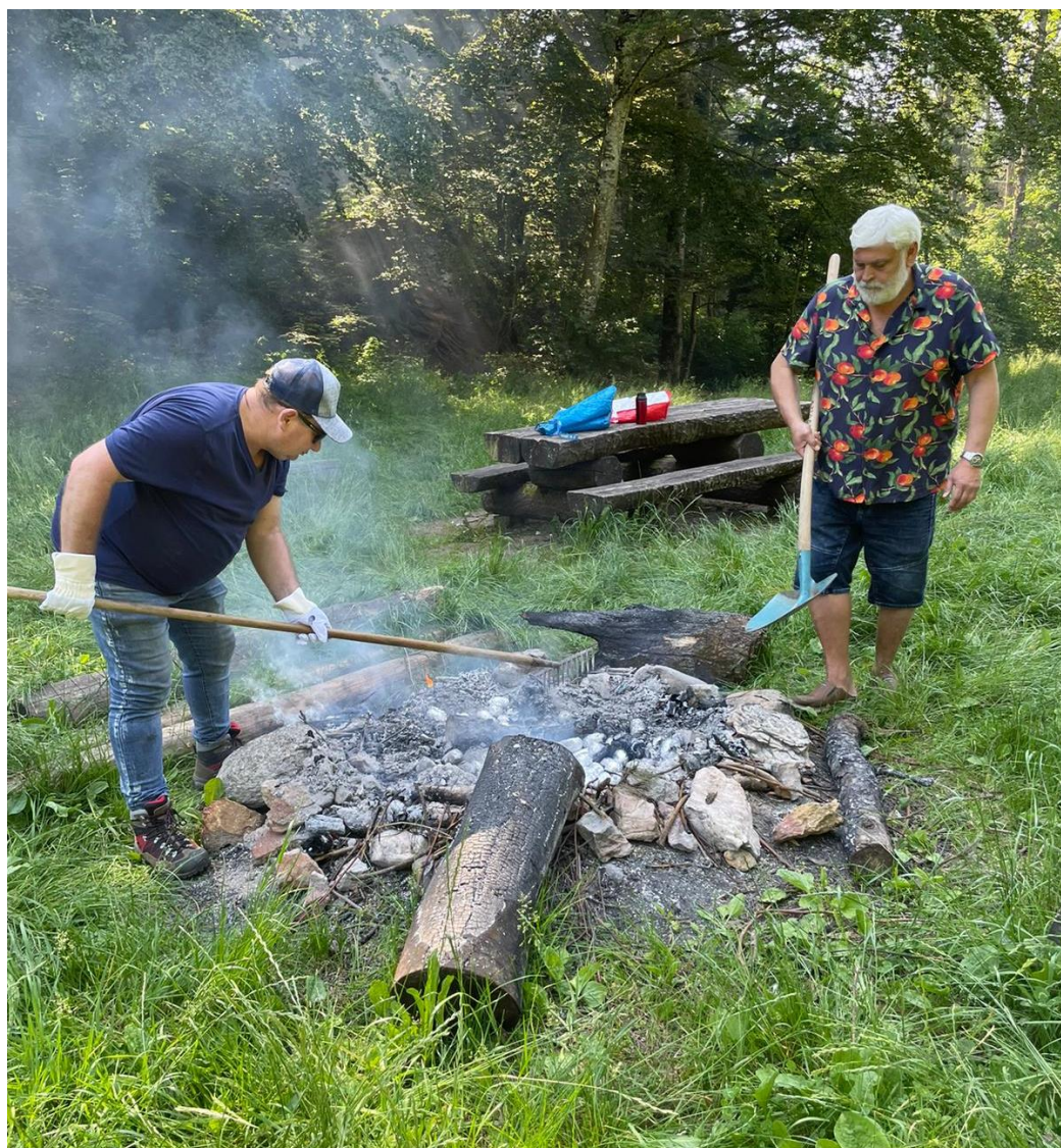
Torrée au Pré Vert 01.06.2023