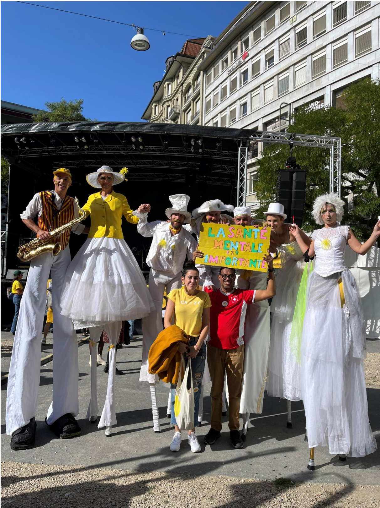
Made Pride 07.10.2023 – Défilé dans les rues de Lausanne