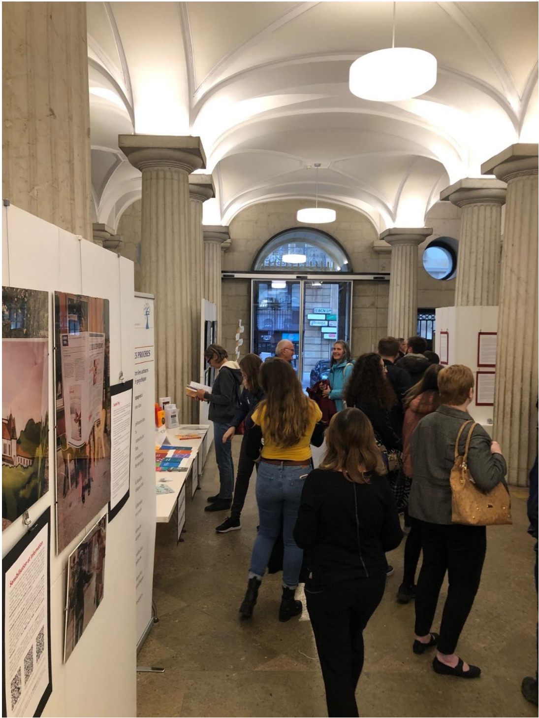
30 ans ANAAP Exposition au Péristyle de l'Hôtel de Ville 07.10.2022 – Vernissage