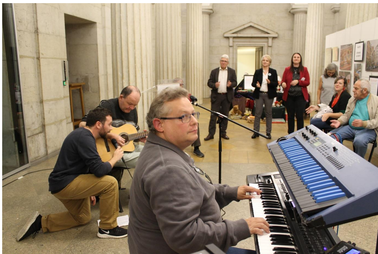
30 ans ANAAP Exposition au Péristyle de l'Hôtel de Ville 07.10.2022 – Rap ANAAP à l'occasion du vernissage