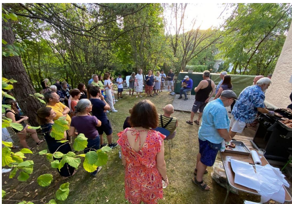
Le Déclic – Dévoilement de l'œuvre peinte sur le monolithe et fête d'Au revoir des stagiaires 25.08.2022