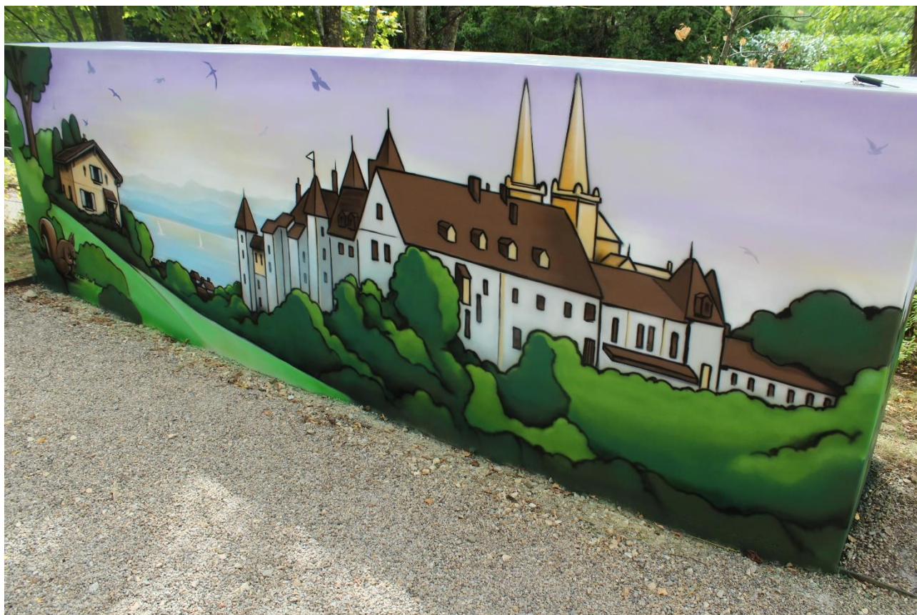
Dévoilement de l'œuvre peinte sur le monolithe 25.08.2022