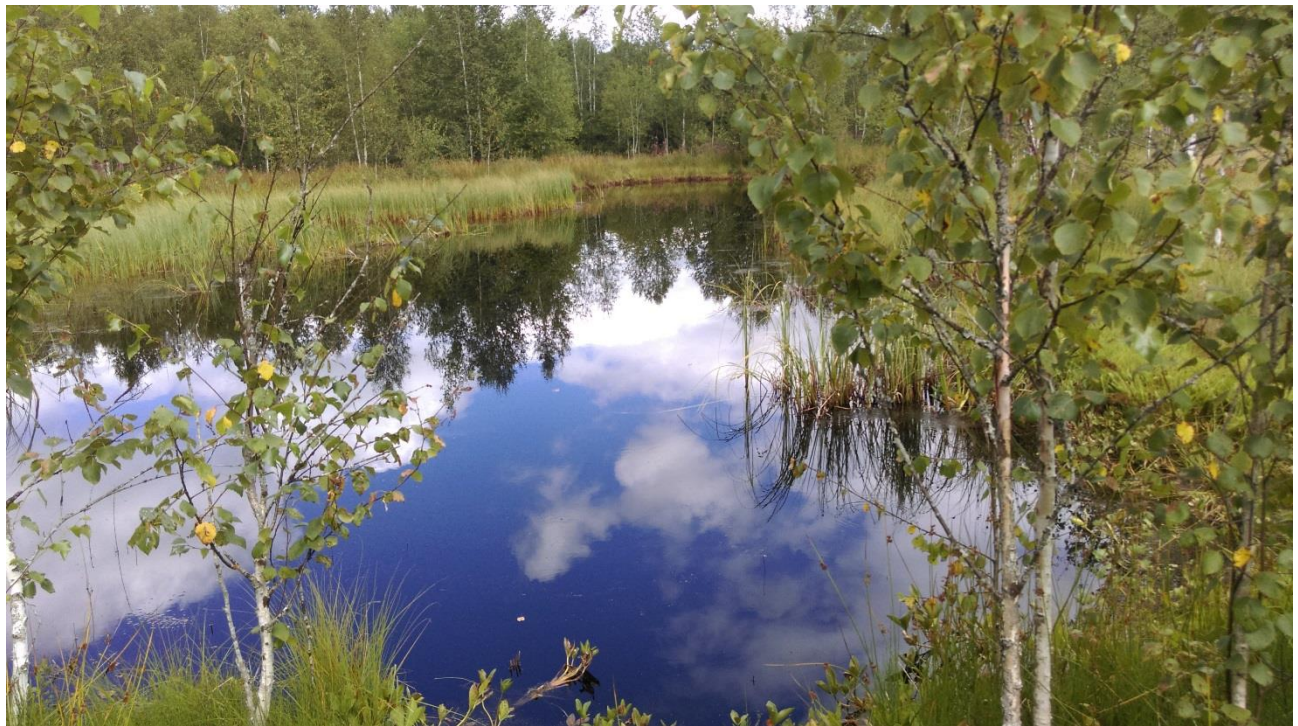
Sortie aux tourbières des Ponts-de-Martel - Août 2016