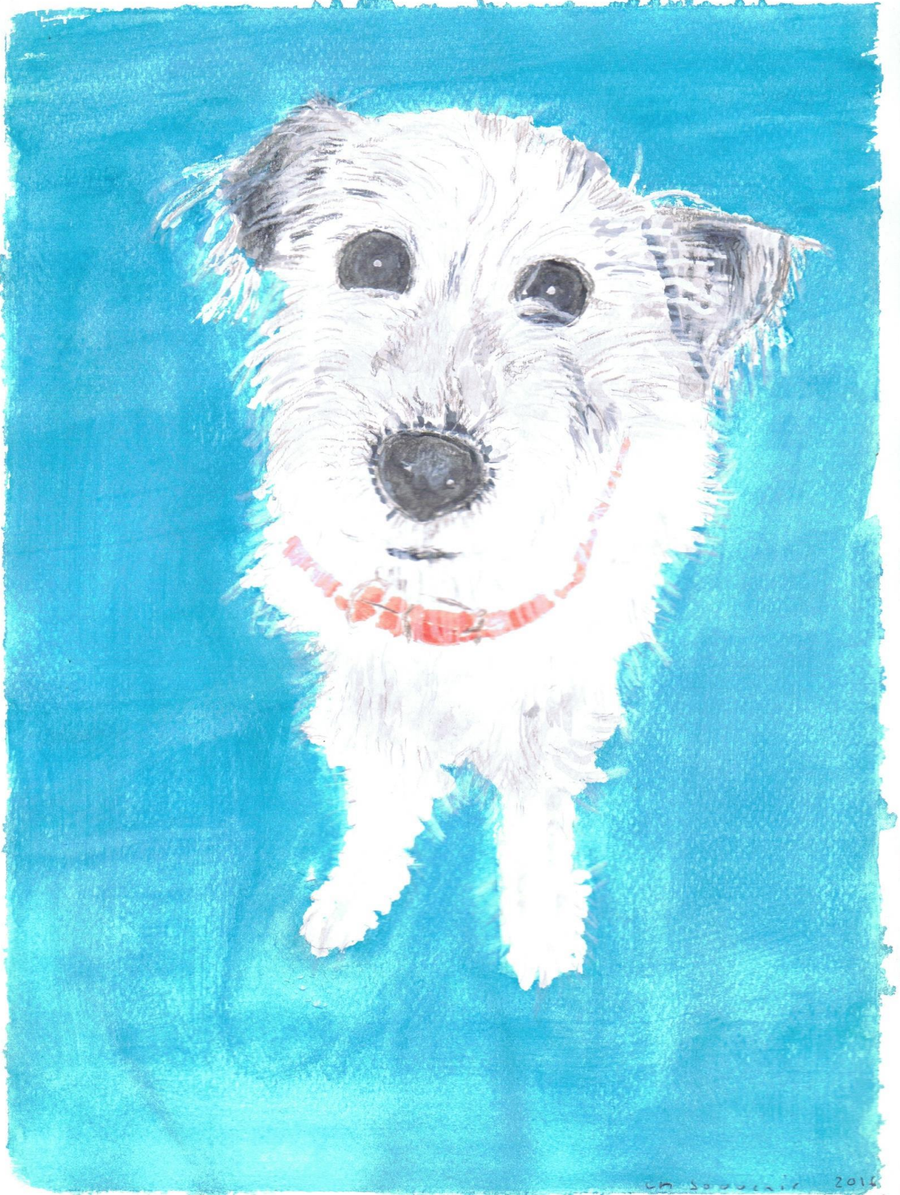
Dessin Yves E. - 2016