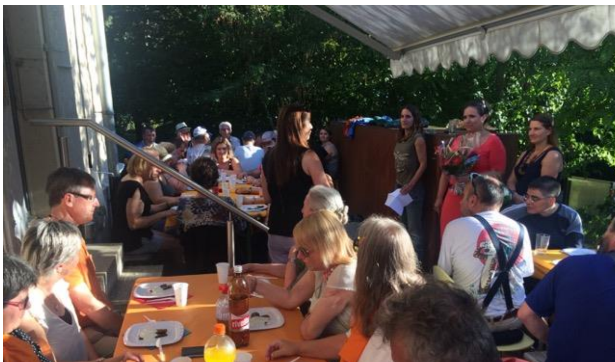
Fête d'Au revoir aux stagiaires - Août 2016